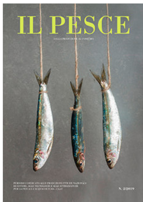
Rubrica: Pesca (Articolo di pagina 46)